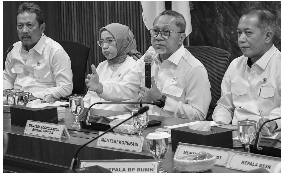
PERKEMBANGAN PENGADAAN SDM KOPDES MERAH PUTIH : Menko Bidang Pangan sekaligus Ketua Satgas Pembentukan Koppes Merah Putih Zulfitri Hasan (kedua kanan), didampingi MenPAN-RB Rini Widayanti (kedua kiri), Menteri Kelautan dan Perikanan Sakti Wahyu Trenggono (kiri) dan Menteri Koperasi Ferry Joko Juliantono menyampaikan keterangan pers terkait perkembangan pengadaan sumber daya manusia (SDM) Koperasi Desa/Kelurahan Merah Putih (KDKMP) dan Kampung Nelayan Merah Putih (KNMP) di Kantor Kementerian Koordinator Bidang Pangan, Jakarta, Senin (4/5/2026). Pemerintah mencatat jumlah pelamar program rekrutmen manajer Koperasi Desa/Kelurahan Merah Putih hingga batas penutupan pendaftaran pada 24 April 2026 mencapai 639.732 orang dan sebanyak 483.648 pelamar dinyatakan memenuhi syarat administrasi.